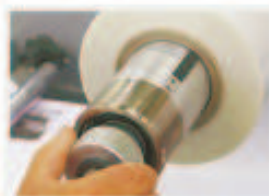
Airshaft for film unwinding