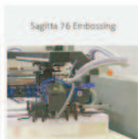
Sagitta 76 Embossing